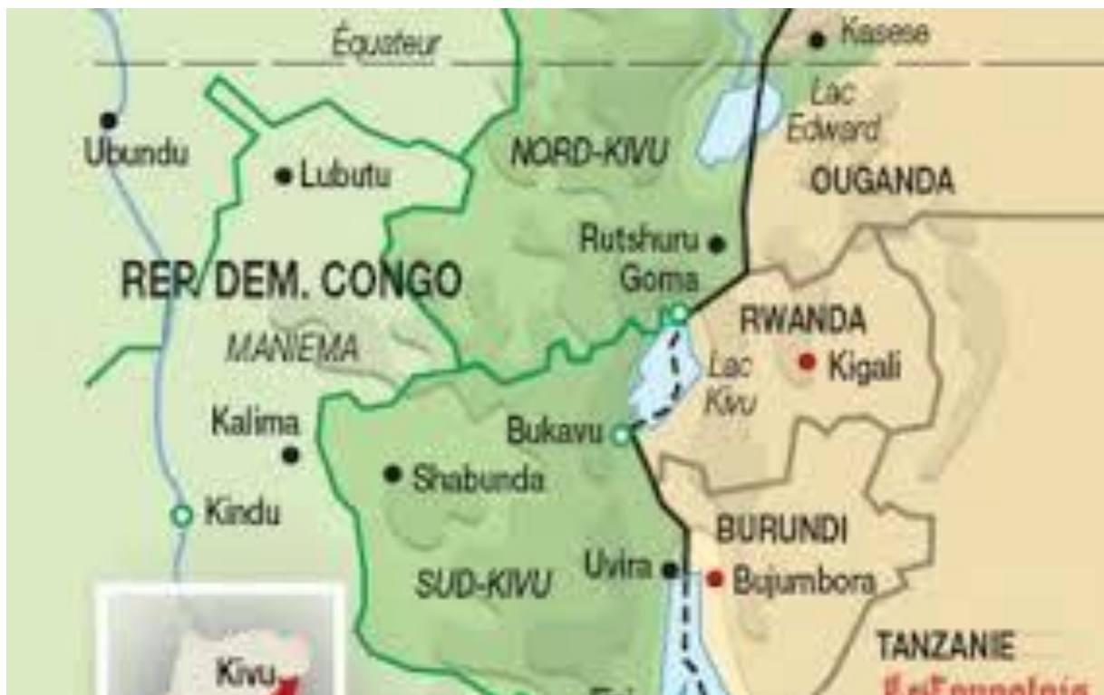
Figure 1: ville d'Uvira dans la Province du Sud-Kivu et dans la sous-région