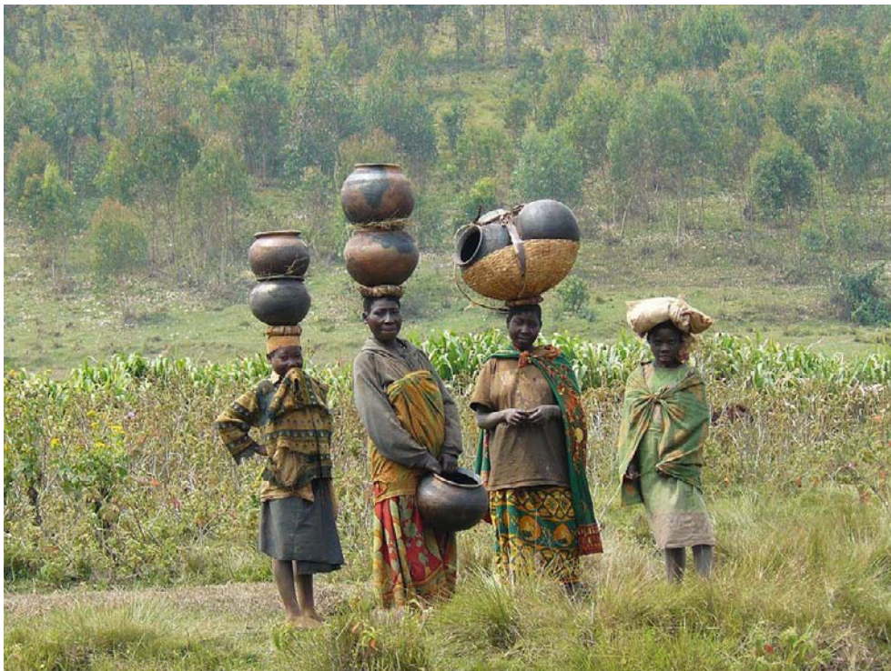
Figure 1: Photo des femmes batwa portant des pots en milieu rural au Burundi