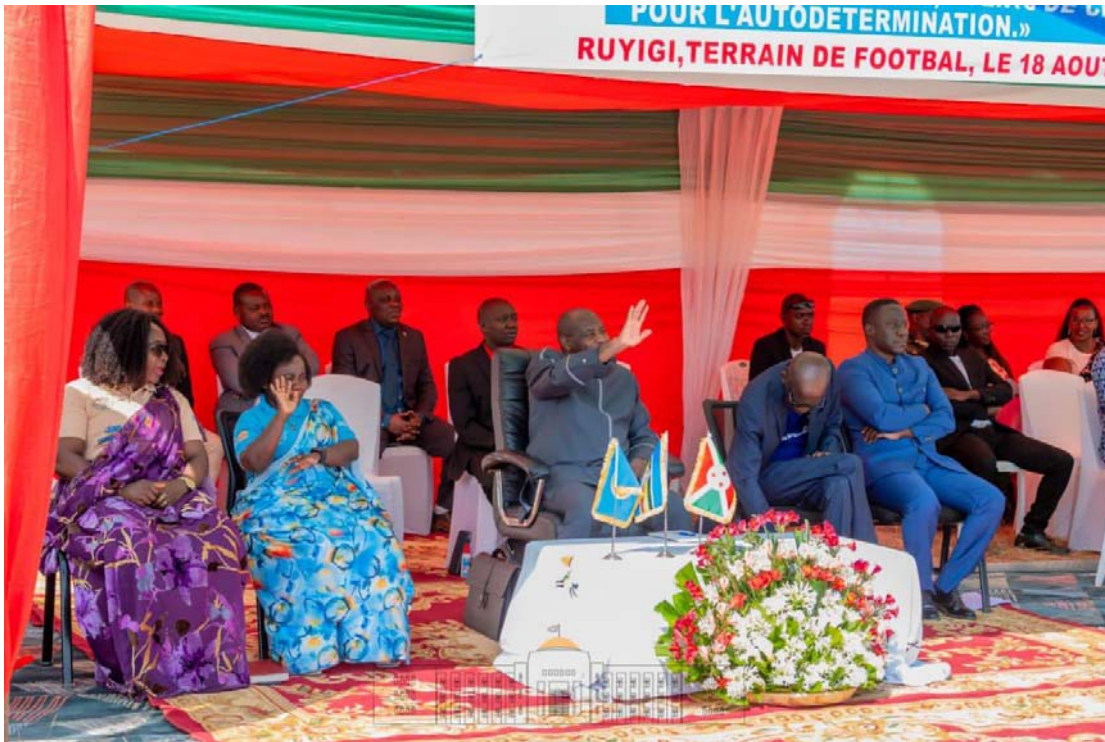
Figure 4: Photo de S.E le Président du Burundi dans la célébration de la Journée Internationale dédiée aux Peuples Autochones à Ruyigi en 2023.