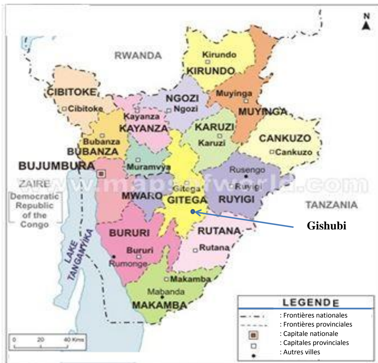
Fig. 1 Carte politique du Burundi