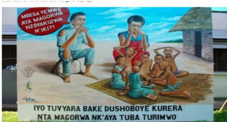
Figure 2 : Panneau publicitaire comme sources d'information