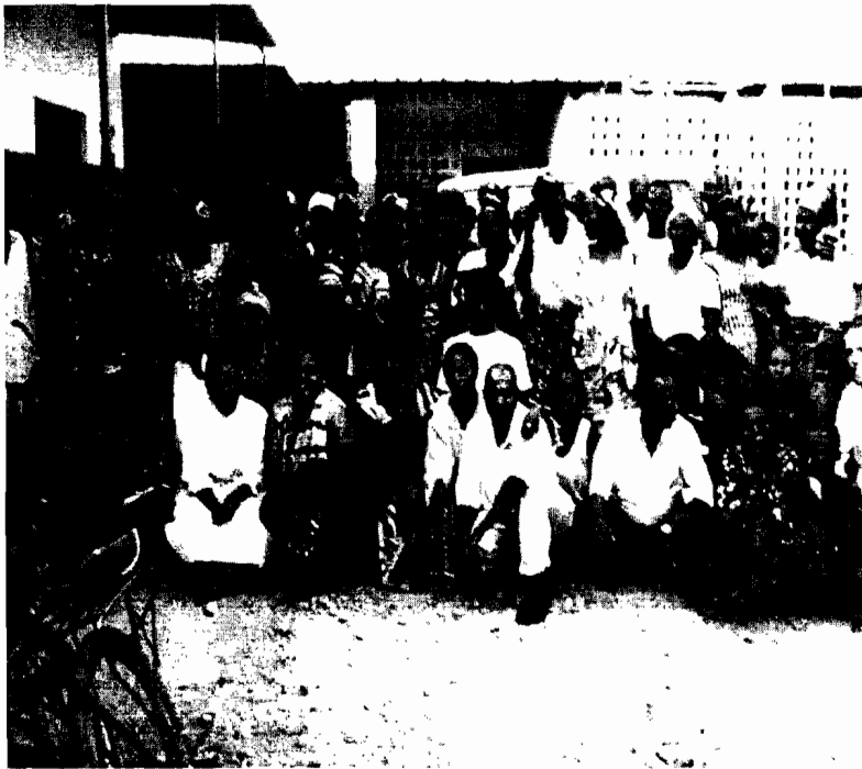
Photo n°1: Les personnes vivant avec le VIH/SIDA encadrées par le centre de santé de Kinama

bases d'un nouveau programme de lutte contre le SIDA. Des recommandations allant dans le sens d'améliorer et de diversifier les interventions ont été formulées. 43