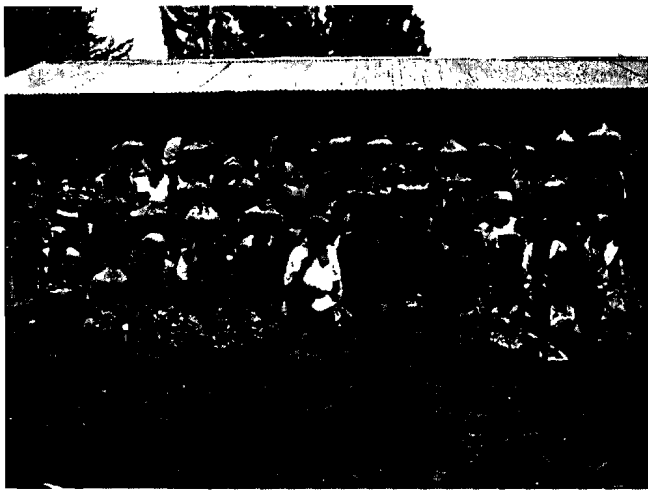
Photo n°2: Les accoucheuses traditionnelles de Buhonga qui venaient de recevoir houes et semences de haricot

Néanmoins, le programme ne couvrait pas toute l'étendue des paroisses du diocèse puisque l'effectif des AT était réduit. Le projet a été exécuté dans 8 paroisses rurales sur les 16 paroisses que compte le diocèse de Bujumbura.