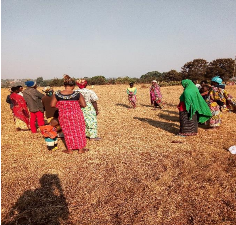
Photo 1 : Groupement solidaire d'épargne et de crédit de la colline Nyabututsi

Les membres de ce groupement commencent par la prière avant de démarrer avec les activités d'épargne et de crédit. Ils intègrent la politique du gouvernement qui postule que Dieu à la première place dans la société Burundaise. Dans ce groupement, il n'y a qu'un seul homme. C'est presque un groupement des femmes seulement puisque la représentativité des hommes est insignifiante.