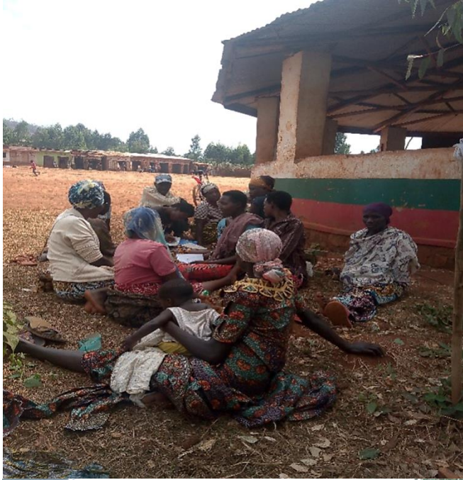
Photo 2 : Groupements solidaires d'épargne et de crédit de la colline Rugari-Gitamo