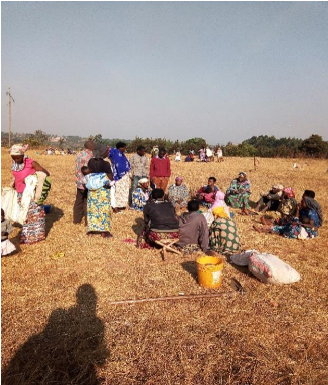
Photo 3 : Groupement solidaire d'épargne et crédit de la colline Songa

Dans les deux premiers groupements, il n'y a aucun homme. Ce sont des groupements féminins. Dans le troisième groupement, un seul homme fait partie de l'équipe. Les autres sont seulement des femmes.