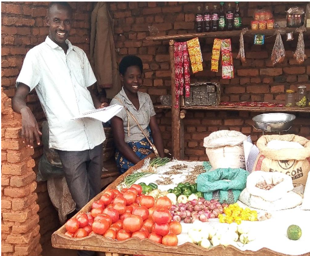
Photo 4 : Une mère célibataire qui se débrouille avec le petit commerce

Lorsqu'il s'agit des ménages dirigés par des femmes (divorcées, célibataires ou veuves), la nécessité d'échapper au chômage devient cruciale pour assurer la subsistance de la famille. Par conséquent, la promotion de l'entrepreneuriat féminin constitue l'un des principaux aspects de l'autonomisation économique des femmes (Gminder, 2004, p.1). Ces propos traduisent la contribution significative des familles monoparentales à la stabilité de leurs ménages. Ces familles décident de participer à la transformation et à la commercialisation de certains articles et denrées alimentaires comme les avocats, les fruits, les cannes à sucre, la farine de maïs ou de manioc, les patates douces en flutes, le charbon de bois, le vin de banane (Urwarwa), etc. Les unes font le commerce sur les marchés locaux, d'autres sur les bordures des routes, d'autres dans leurs ménages respectives et d'autres font le commerce ambulant dans les bars et partout où se concentrent les personnes.