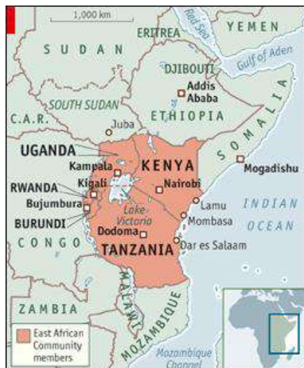
Tableau 16 : Pays de la Communauté Est Africaine (RDC, Soudan du Sud, Burundi, Ouganda, Kenya, Tanzanie, Rwanda et Somalie nouvellement adhéree à la communauté) et les pays limitrophes