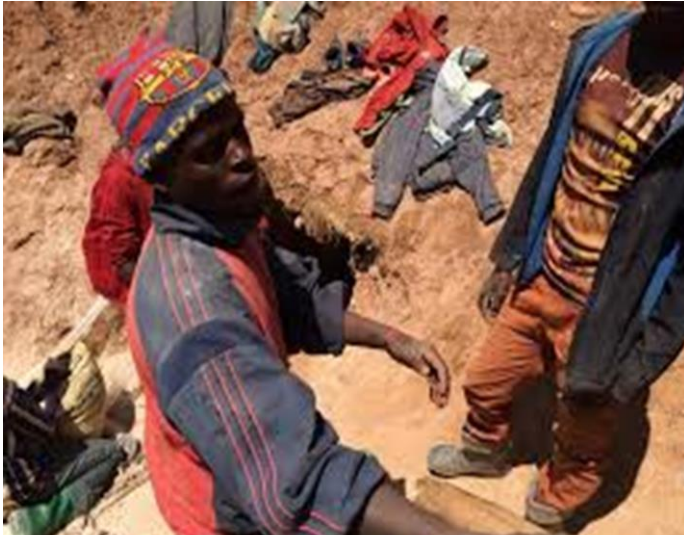
Photo 2: Les ouvriers du site d'exploitation des minerais à Kivuvu

Source : Le gisement d'exploitation des minerais à Kivuvu, les ouvriers sans salopettes ni casques pour leur protection