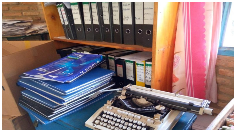
Photo 4: La machine à écrire qu'on utilise on sein de l'Etat civil en commune Kabarore