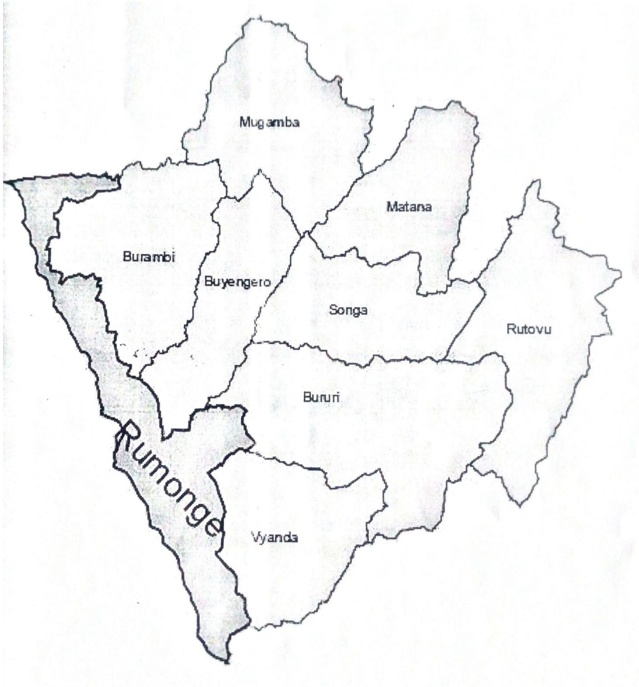
Figure : Carte de la province Bururi

Source : NINTUNZE Janvier, La crise de 1972 en commune Rumonge : essai d'interprétation , Bujumbura, UB, FLSH, Histoire 2016, p.29