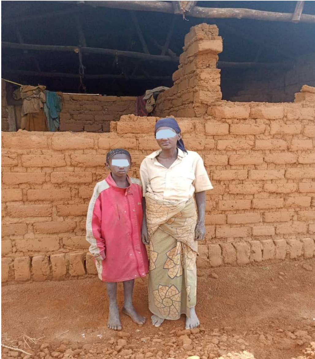
Photo 1. Une mère célibataire avec son fils sur la sous-colline KIZINGOMA, colline KIRAMA, Zone MAKAMBA

A cause de la pauvreté regarde notre maison, elle est détruite suite aux fortes pluies mêlées du vent un passant regarde à l'intérieur de la maison et voit les outils comme les ustensiles de cuisine, les habits rangés sur le montant de la porte ,etc. C'est dur. Maintenant c'est la saison sèche mais quand viendra la saison des pluies, je crains que la maison soit totalement détruite, vue son état physique.