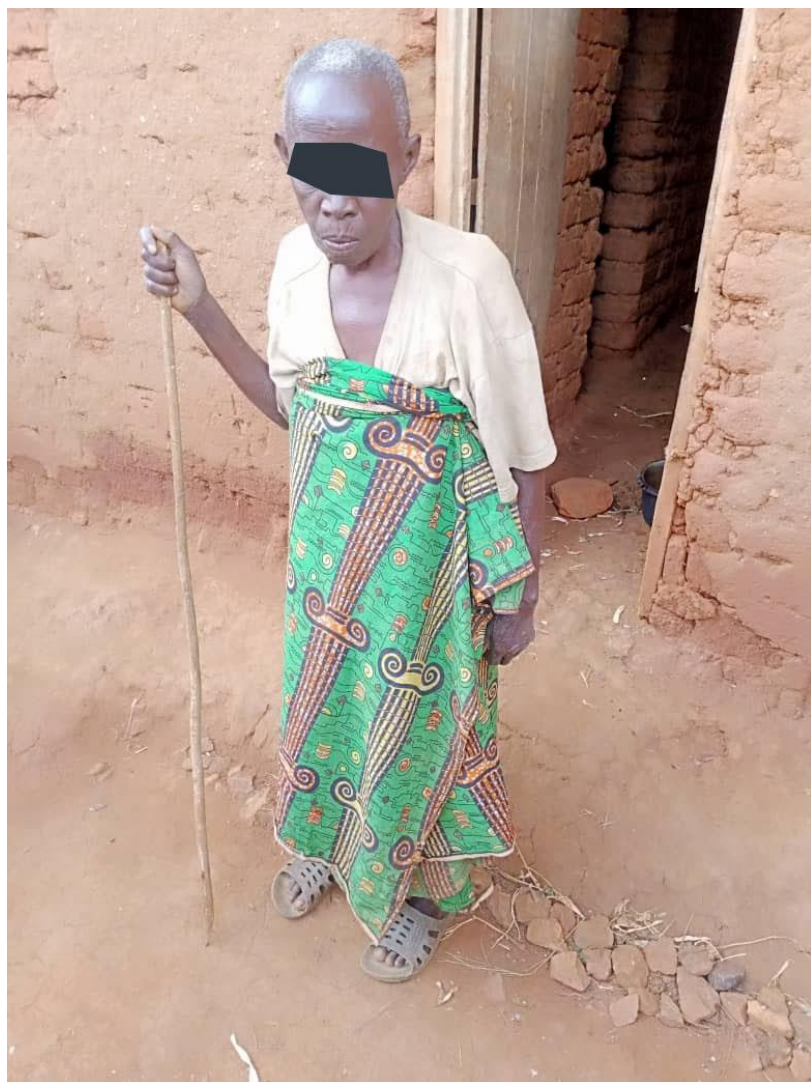
Photo 2. : Une octogénaire tutrice de 5 orphelins sur la colline MURESI

« Dans les années passées quand j'avais encore de la force c'est moi qui leur donnait le nécessaire, c'était possible mais aujourd'hui nous sommes vieux, ce sont ces enfants qui nous soutiennent.