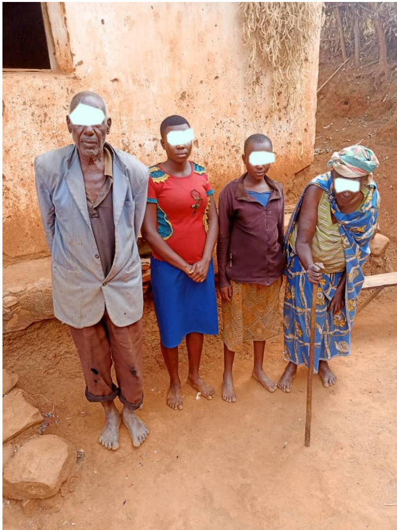
Photo 3. Deux orphelines au milieu de leurs grands-parents sur la Colline Mugutu, Zone Makamba

Nous sommes en collaboration avec Abana Makamba depuis longtemps l'orpheline avait 3 ans, maintenant elle va terminer les études secondaires. Nous nous sommes connus avec Abana Makamba grâce aux chrétiens qui sont allés demander notre aide auprès cette association.