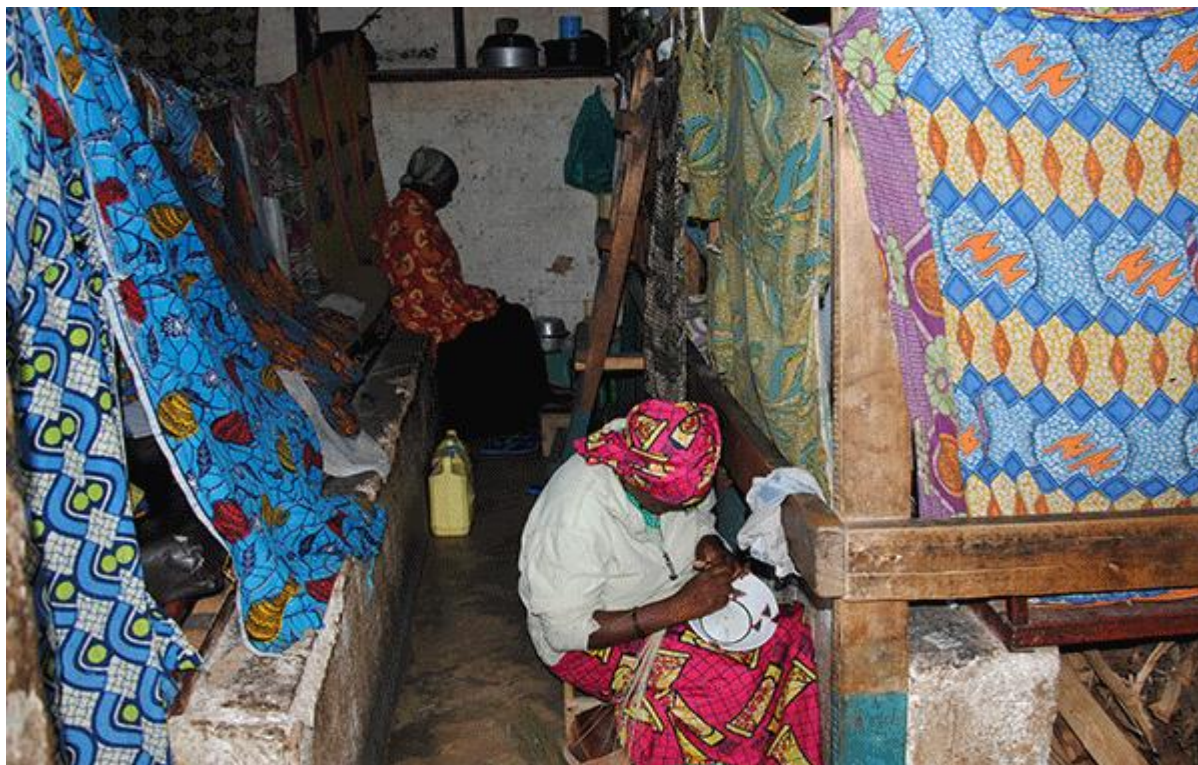
Figure 1 : L'image d'une literie à la prison centrale de Ngozi-femme en 2016

Source : PNUD Burundi / Geneviève DELAUNOY / 2016 - Vue sur une cellule de la prison pour femmes de Ngozi au Burundi