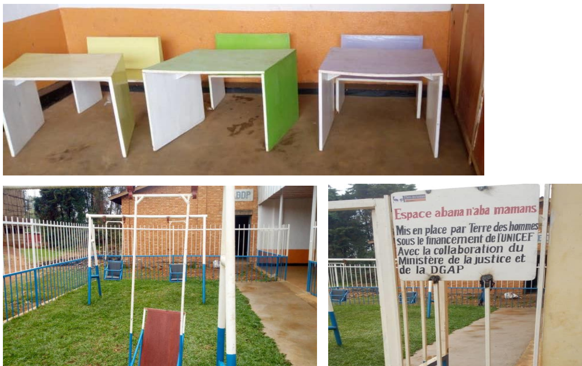
Figure 2 : La crèche de la prison centrale Ngozi-femme