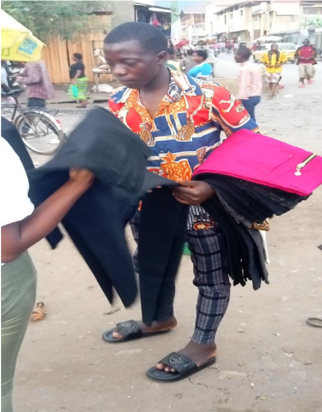
Photo 3 : Vendeur ambulant de vêtements rencontré près du marché Kamenge

Source : Cliché auteur, Prise le 27 Mars 2024