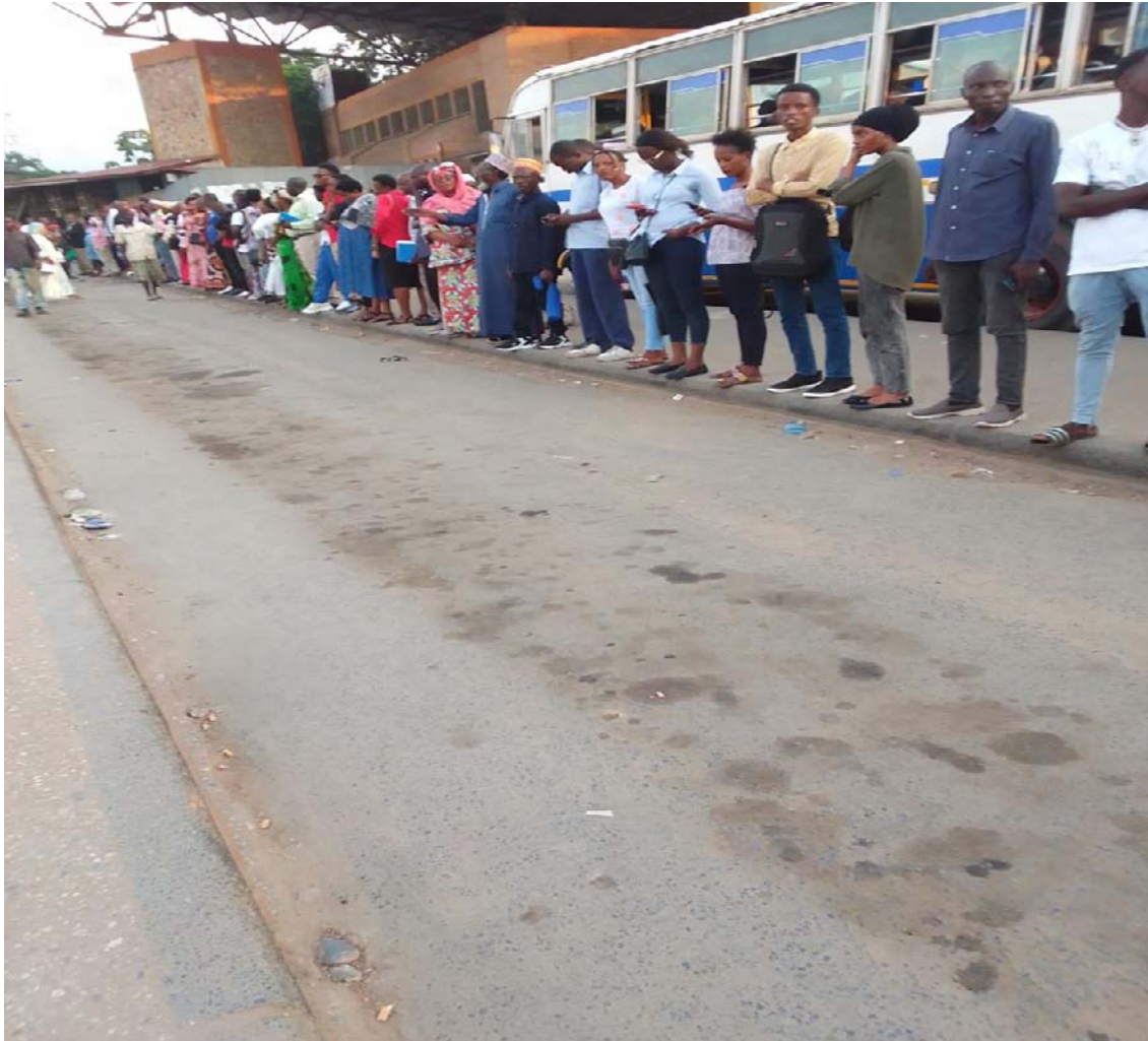
Figure 5: Les passagers au centre-ville sur une file d'attente