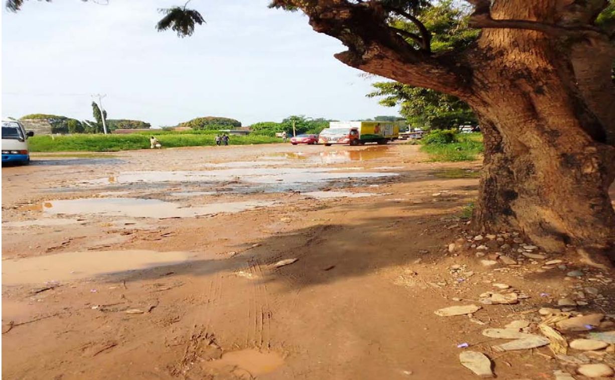
Figure 2: Boulevard Lieutenant Général Adolphe NSHIMIRIMANA en état de dégradation.