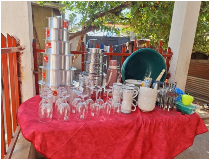
Photo prise par le membre du bride shower

Le groupe comprenait un nombre de 56 personnes et 38 ont pu contribuer. Pendant la bride, une somme de 860.000frbu a aidé à acheter les éléments qu'elle n'avait pas encore acheté. Curieusement, la plupart de ces matériels restent comme des décors dans l'armoire. La somme qui est resté est mis dans une enveloppe et lui a été remise en liquide.