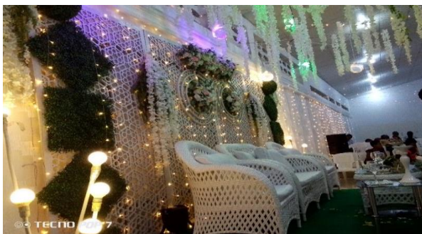
Photo prise par nous-même sur terrain avant le mariage

Photo illustrant une salle de réception avec décor préféré