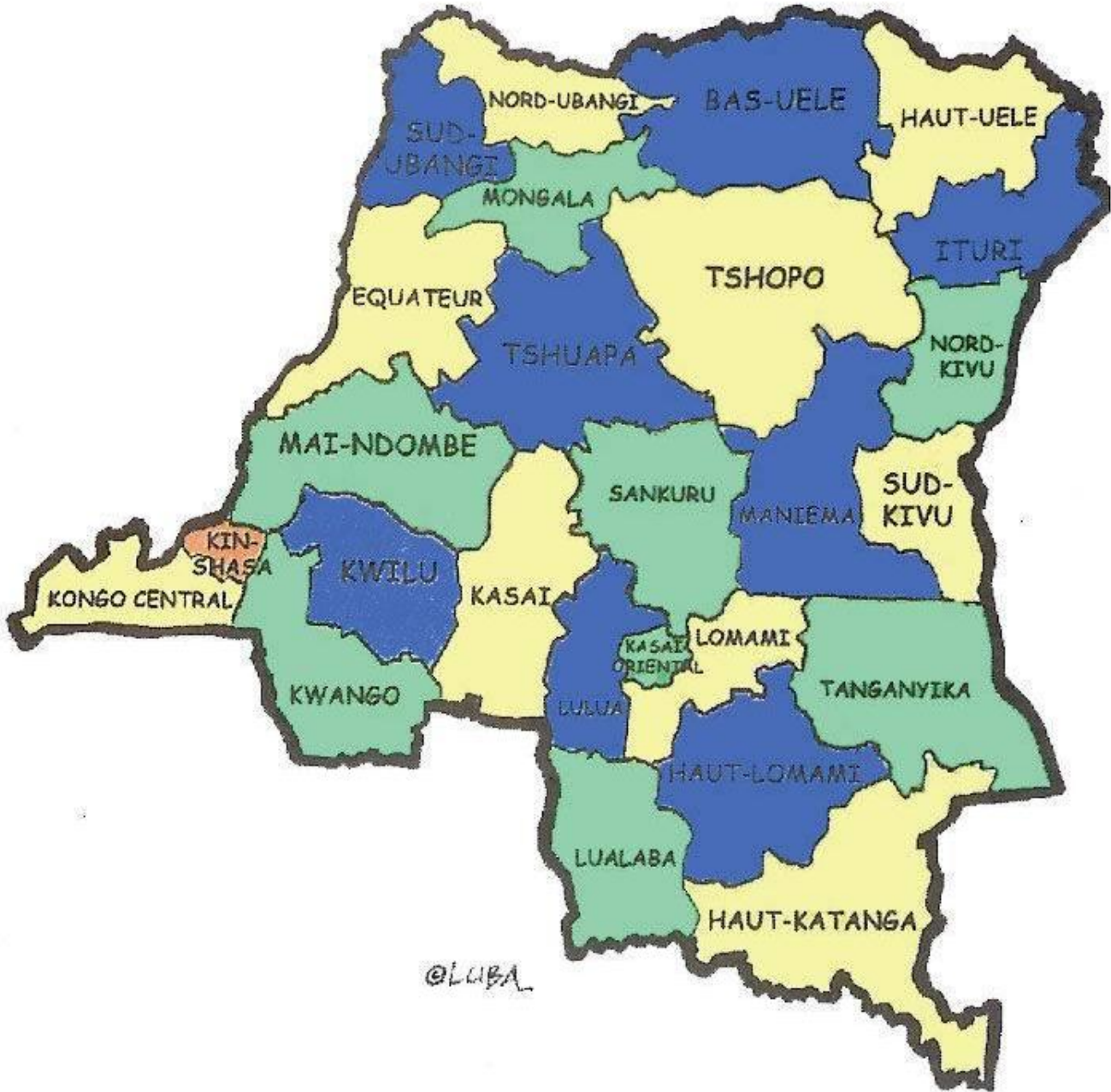
Figure 1 : Carte administrative des provinces de la RDC