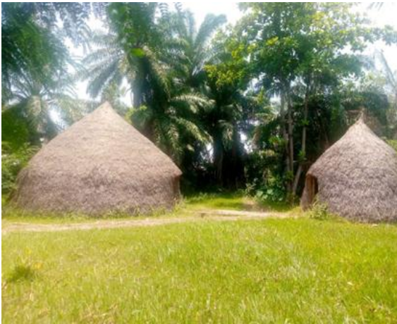
Le Rugo traditionnel