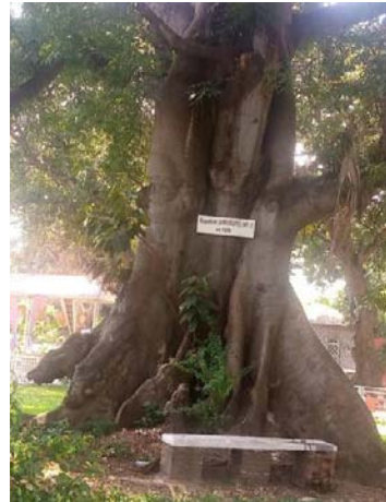
L'arbre de Kunama

Les photos 1,2 et 3 nous présentent la diversité de la faune et de la flore qu'on retrouve dans le musée vivant de Bujumbura. Ceux-ci sont à cet effet une source d'attraction pour l'expansion du tourisme urbain.