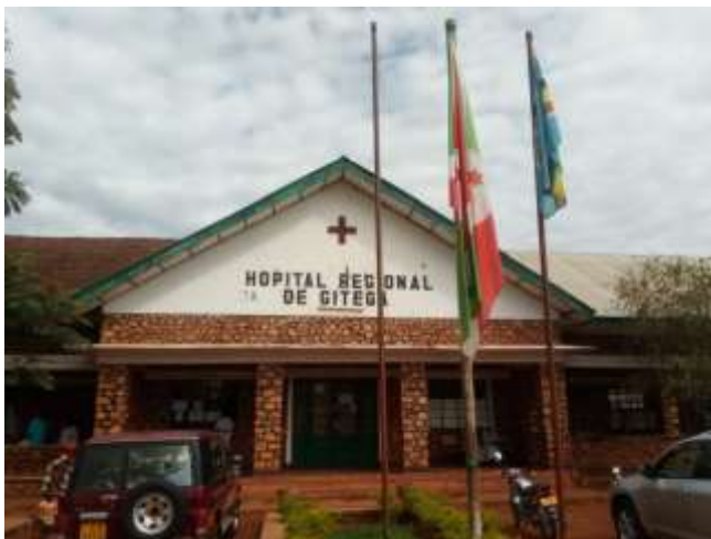
Figure 3 : Photo de l'Hôpital Régional de Gitega

Actuellement, l'Hôpital compte 4 services : Médecine Interne, Chirurgie, Pédiatrie et Gynéco-obstétrique.