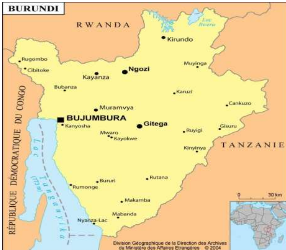
Figure 2 : Carte de la République du Burundi [72]

-Au Sud, par les provinces Bururi (communes Matana et Rutovu) et Rutana(communes Rutana et Musongati).