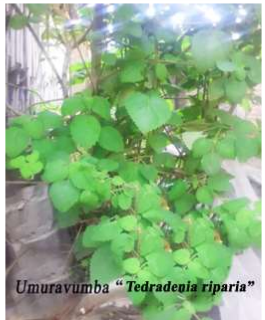
Umuravumba "Tetradenia riparia"