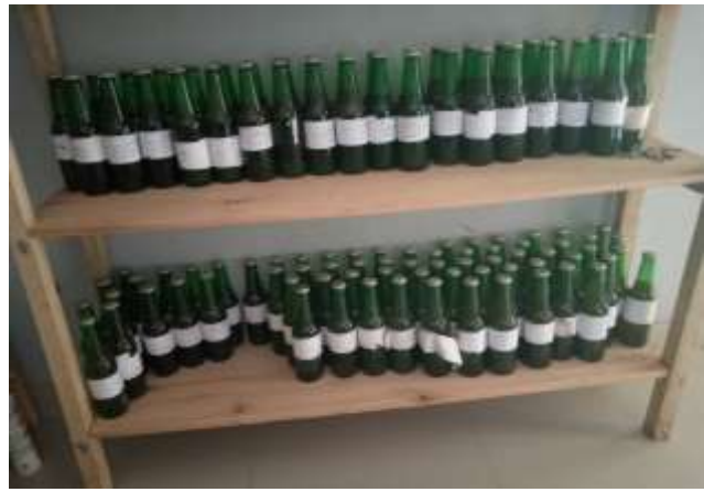
Argile verte, blanche et jaune et autres médicaments naturels en bouteilles