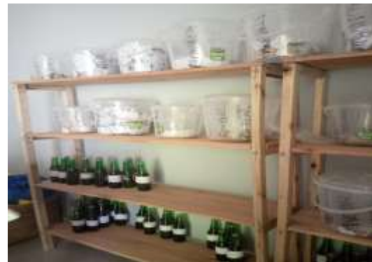
Médicaments au Centre de la médecine traditionnelle de l'Association « Incuti ya bose », Bujumbura