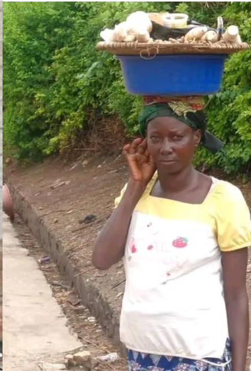
Une femme qui était en train de vendre des maniocs et arachides à la 2 e me Avenue de Kamenge. Photo prise par l'auteur le 17 novembre 2023