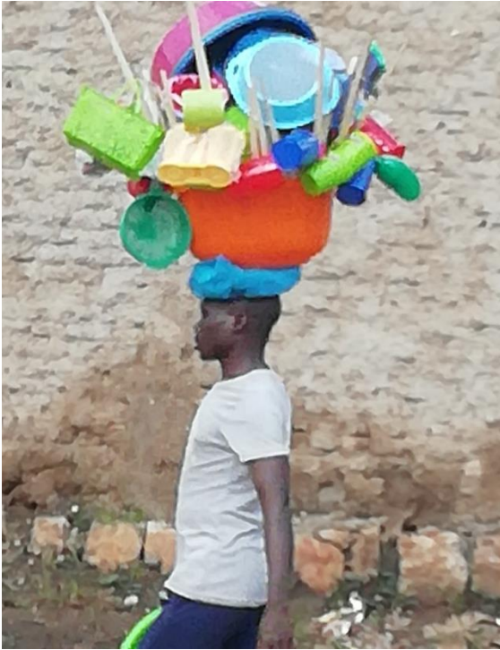
Un homme qui était en train de vendre des objets culinaires dans la rue vers la zone Gihosha. Photo prise par l'auteur, le 17 novembre 2023