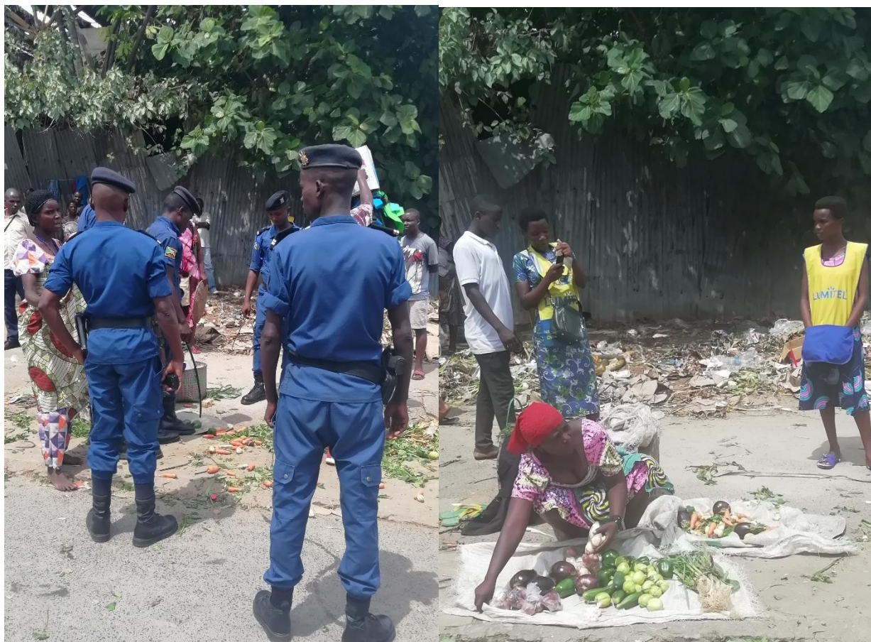
Des polices qui étaient en train de déguerpir les femmes vendeuses des légumes en face de l'ex-marché. Photo prise par l'auteur le 27 octobre 2023