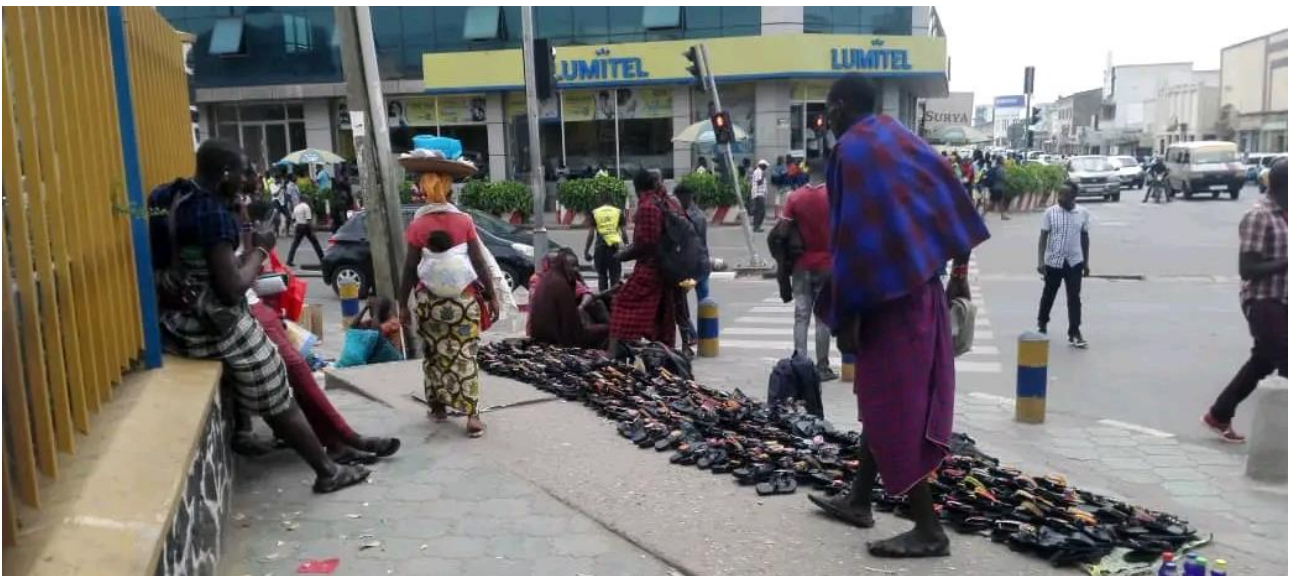
Des Massaïs en face du bureau Lumitel en commerce de rue. Photo prise par l'auteur, le 28 décembre 2023